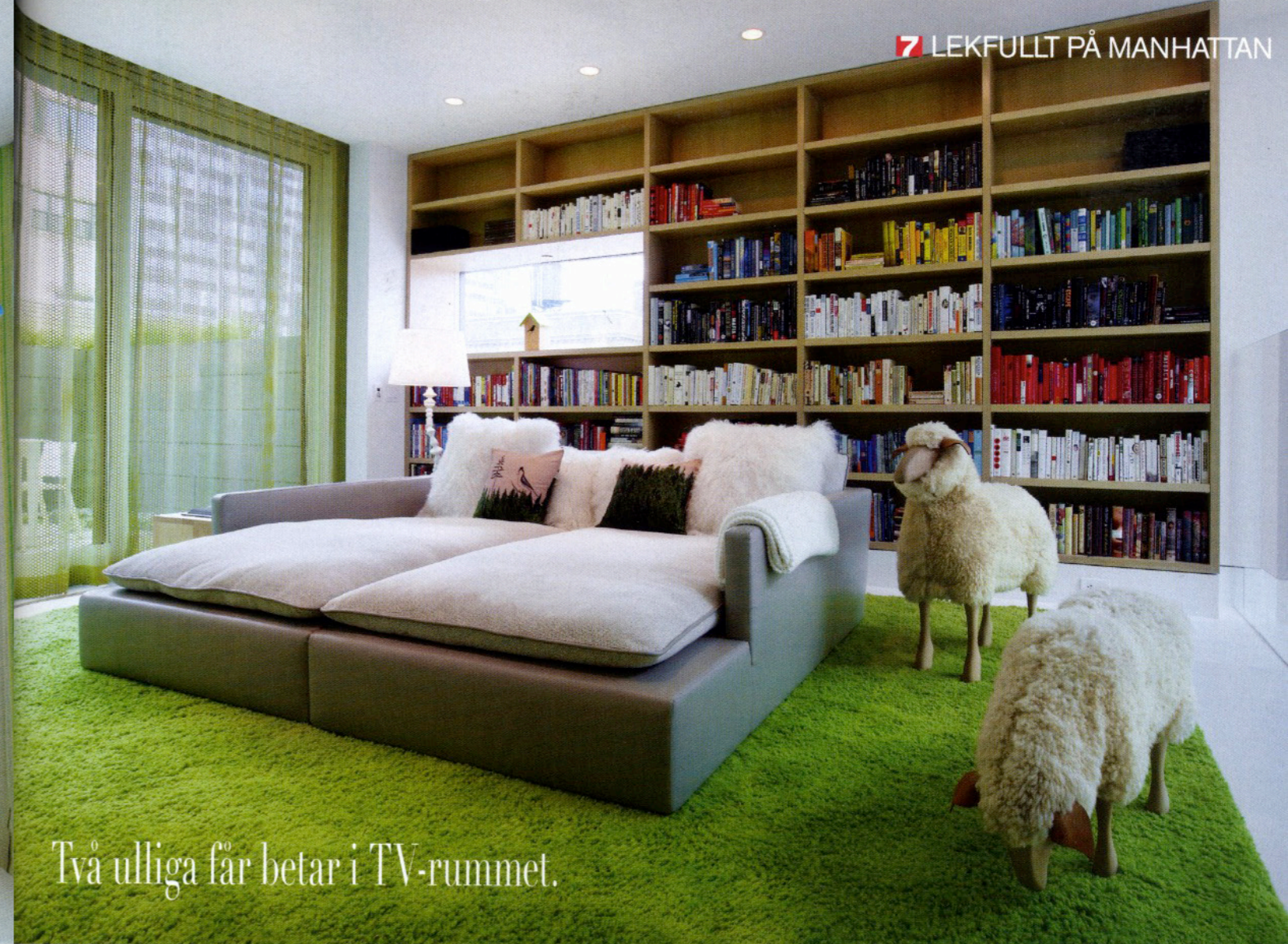
Två ulliga får betar i TV-rummet.