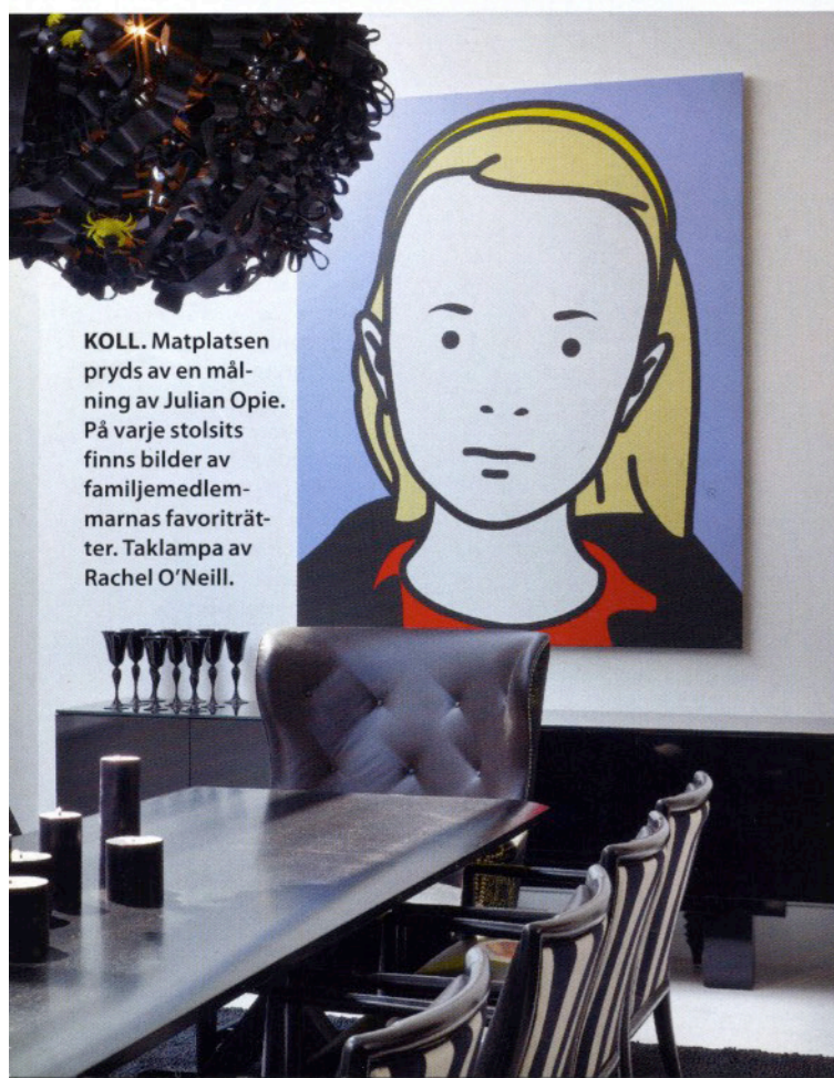
KOLL. Matplatsen pryds av en målning av Julian Opie. På varje stolsits finns bilder av familjemedlemmarnas favoriträtter. Taklampa av Rachel O'Neill.