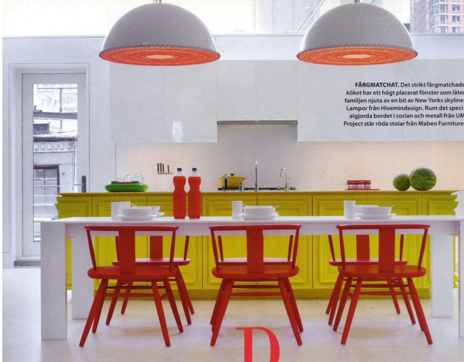
FÄRGMATCHAT. Det strikt färgmatchade köket har ett högt placerat fönster som låter familjen njuta av en bit av New Yorks skyline. Lampor från Hivemindesign. Runt det specialgjorda bordet i corian och metall från UM Project står röda stolar från Mabeo Furniture.