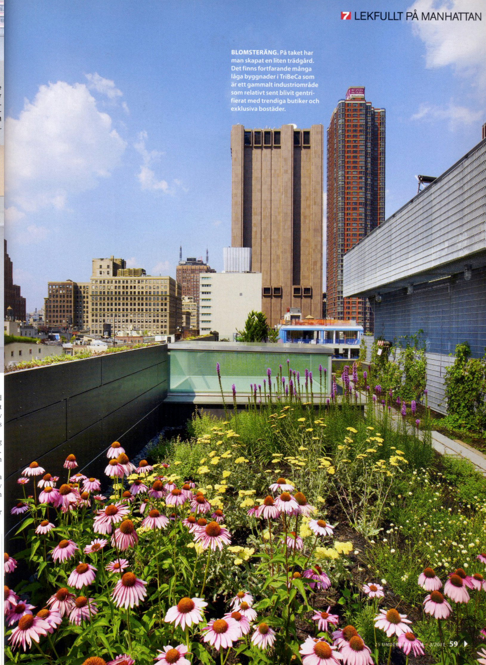
BLOMSTERÄNG. På taket har man skapat en liten trädgård. Det finns fortfarande många låga byggnader i TriBeCa som är ett gammalt industriområde som relativt sent blivit gentrifierat med trendiga butiker och exklusiva bostäder.